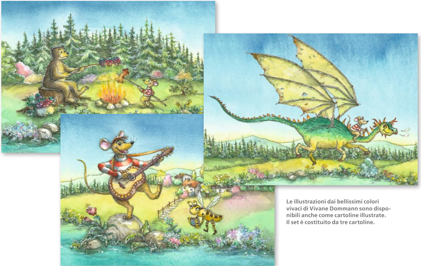
Le illustrazioni dai bellissimi colori vivaci di Vivane Dommann sono disponibili anche come cartoline illustrate. Il set è costituito da tre cartoline.